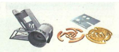
サンプルワーク展示