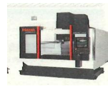
工作機械実機見学

FG-400 NEO および STX-3015 による加工を実演いたします。3D レーザヘッドによる自在な加工パフォーマンス、先進のレーザ加工技術による高速切断をご体感ください。