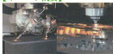
レーザ加工機実機見学