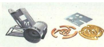
サンプルワーク展示