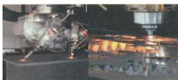
レーザ加工機実機見学